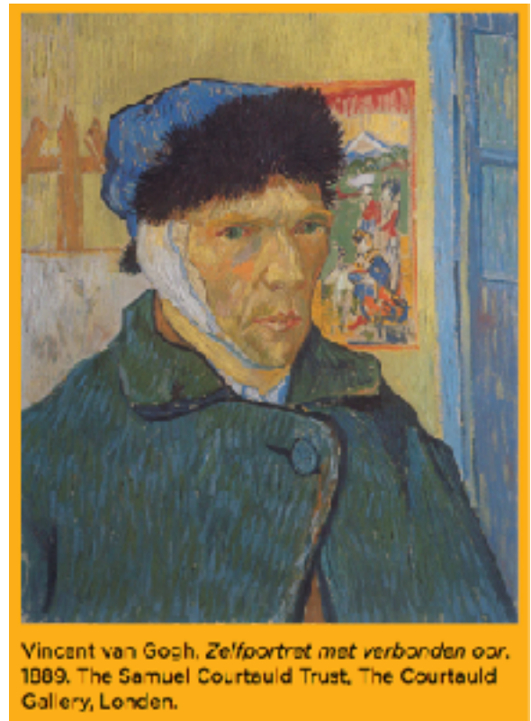
Vincent van Gogh, Zelfportret met verbonden oor , 1889. The Samuel Courtauld Trust, The Courtauld Gallery, Londen.

https://museumoudeslot.nl/collectie/?query=bedevaartvaantje