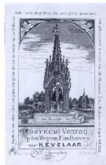
Overnachten in Oostrum en Venray op de weg naar Kevelaer. Het is een religieuze broederschap op de laatste punt bedevaartgangers op weg naar de kapel.